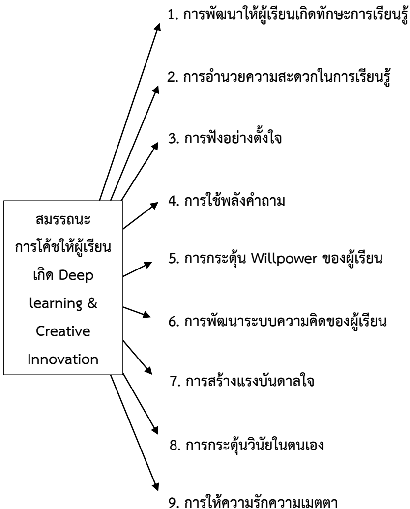
ภาพประกอบ 1 สมรรถนะการโค้ชให้ผู้เรียนเกิด Deep learning & Innovation